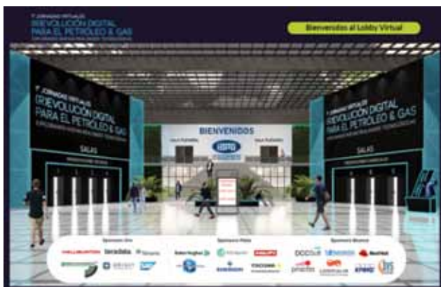
Figura 2. Lobby virtual de las JReD.

La joven Comisión de Innovación Tecnológica (CIT) estaba planificando un evento puente entre las JIT3 (de 2019) y sus cuartas Jornadas (JIT4.0). Las tres anteriores habían tenido una difusión y una participación en aumento. Al asociarnos con la CGI, el formato del evento tendría la envergadura acorde con las JIT4.0. Cuando apareció la contingencia del covid-19, y había gran incertidumbre en varias aristas, desde las dos comisiones impulsamos con definición el evento virtual con el fin de reducir los frentes de indecisión, pero sobre todo con la idea de aprovechar una oportunidad particular.