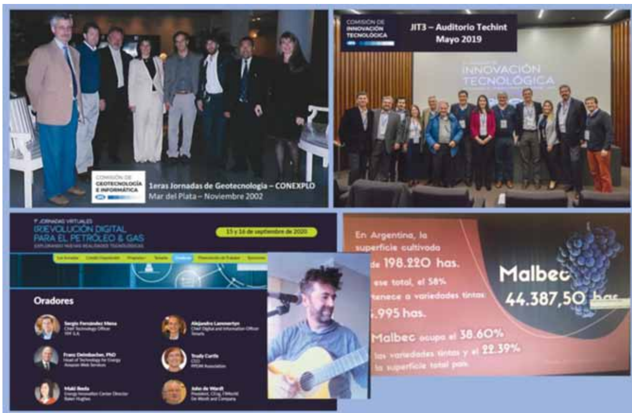
Figura 1. Antes de las JReD y durante las JReD.